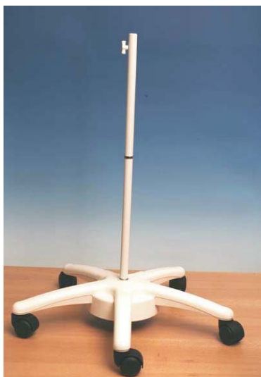
Bodenständer Art. Nr. 16-10500