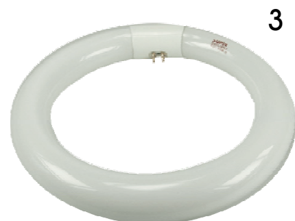
3 Ersatzröhren zu o.g. Leuchten

16-10021 Ersatzröhre 16 W Tageslicht für 16-10020