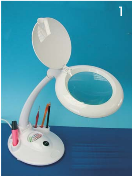
1 Tageslicht Tisch-Lupenleuchte mit integriertem Organizer, 16 W Art. Nr. 16-10020

Lupe und Beleuchtung kompakt in einem Gerät vereint! Ideal zum Handarbeiten (z. B. Sticken), Modellbau, für Nagelstudios, Philatelie und viele weitere Hobbys! In den Abteilungen des Organisers im Leuchtenfuß haben Sie Ihr Werkzeug und/oder Stifte immer griffbereit. Durch die handliche Größe kann die Lupenleuchte leicht transportiert werden.