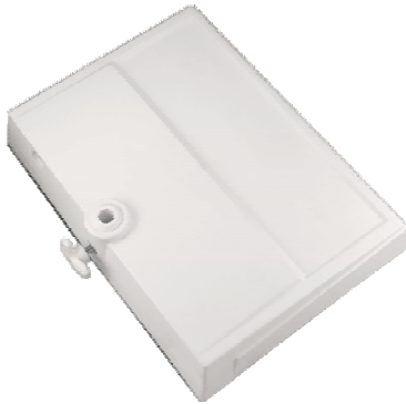
Schwerer Tischfuß Art. Nr. 16-10501