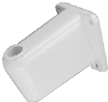
Wandhalterung Art. Nr. 16-10502

Passend zur Dreifach-Neon- Tageslichtleuchte 16-10000