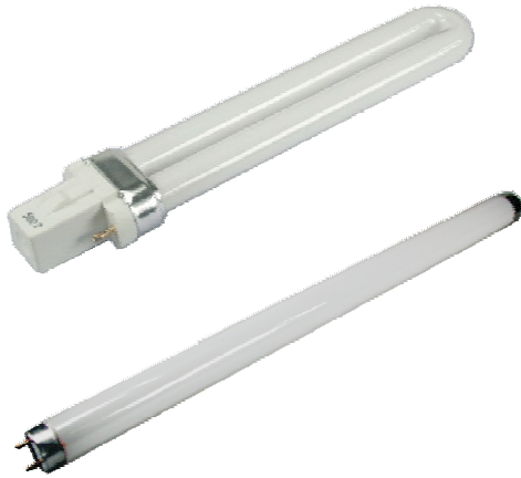
Tageslicht Ersatzröhre 9 W Art. Nr. 16-10011

Passend zur Tageslicht Lupenleuchte 16-10010