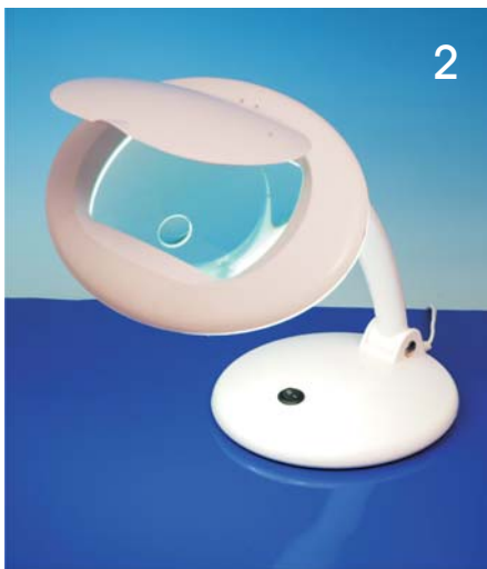
2 Tageslicht Tisch-Lupenleuchte mit extra großer Linse 22 W Art. Nr. 16-10030

Tischlupenleuchte mit extra großer, rechteckiger Linse. In diese ist eine kleine, stärkere Linse mit 4-facher Vergrößerung eingearbeitet. Die Linse kann bis auf Tischplattenniveau heruntergebracht werden.